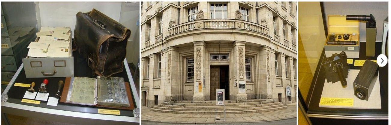
Musée du "Runden Ecke"

Cette petite exposition présente des équipements et des objets ayant appartenu à la redoutée police secrète de la Stasi.